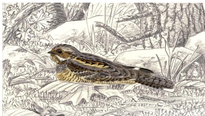
Dessin : S. Nicolle

Oiseau de taille moyenne au plumage brunâtre finement chiné lui permettant d'être parfaitement camouflé au sol ou sur une branche d'arbre en journée. De mœurs crépusculaires et nocturnes, on identifie sa présence par son ronronnement continu et sonore rappelant le bruit lointain d'une moto. Il présente une cavité buccale démesurée et des vibrisses aux commissures du bec lui permettant de capturer des insectes en vol.