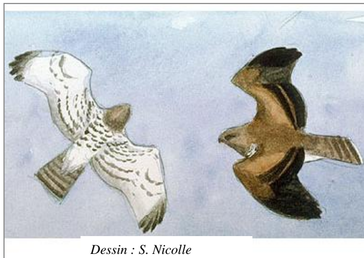
Dessin : S. Nicolle

Rapace diurne de bonne taille (160-180 cm d'envergure) remarquable par sa grosse tête et ses grands yeux jaunes. Plumage : tête et gorge brun sombre, dessous blanc piqueté de brun ; dessus bicolore brun roussâtre et rémiges presque noires. Son vol sur place et sa silhouette massive sont des plus caractéristiques.