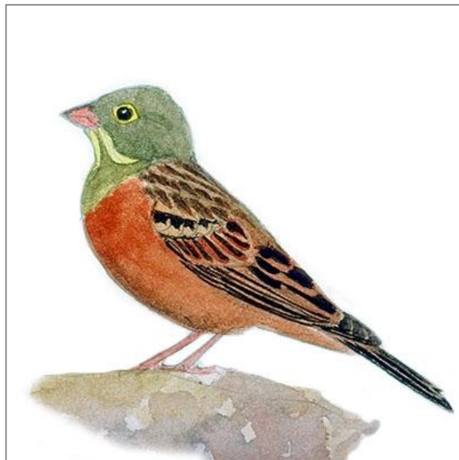
Dessin : S. Nicolle

Bruant élancé reconnaissable au net cercle oculaire jaune et à ses moustaches jaune clair. Le mâle en plumage nuptial est brun orangé sur les flancs et le ventre ; tête, nuque et poitrine sont gris olivâtre. Les plumages des femelles et des jeunes sont plus ternes et plus ou moins rayés sur la poitrine, la nuque et la tête. Les pattes et le bec sont roses. Assez farouche.