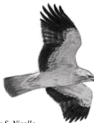
Dessin : S. Nicolle

L'Aigle botté est un rapace de taille moyenne et le plus petit représentant de la famille des aigles. Les adultes peuvent présenter des plumages très variables allant du brun-uniforme (« phase sombre ») au blanc-beige (« phase claire »). En vol, l'espèce est identifiable aux motifs blancs typiques du dessus des ailes. Les individus de phase claire -majoritaires- sont aisément identifiables au contraste blanc-noir du dessous des ailes.