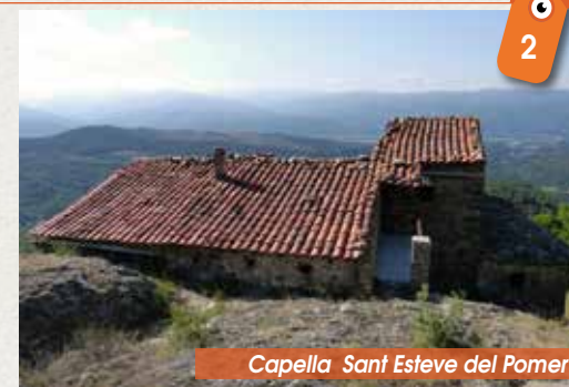
Capella Sant Esteve del Pomer

De cette ancienne forteresse comtale, il ne reste à ce jour que les soubassements d'une tour carrée. La chapelle fut, quant à elle, reconstruite au X e siècle suivant le style préroman puis, au XI e , ses murs furent surélevés afin de recevoir une voûte en berceau. La chapelle de Sant Esteve de Pomers devint un ermitage dès la fin du XVII e siècle.