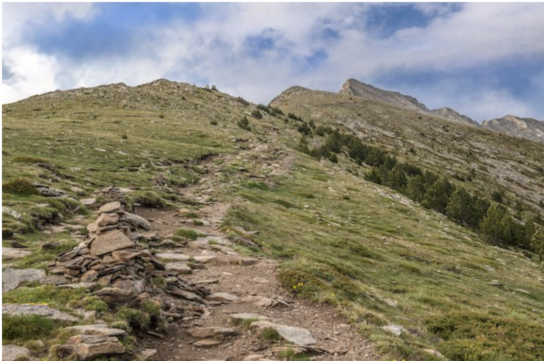
Sentier du pic, massif du Canigó

Des paysages exceptionnels, des patrimoines naturel et culturel riches, une histoire géologique, naturelle et humaine forte, font du massif du Canigó un site de grande valeur.