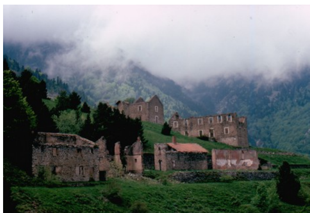
La Pinosa

Aujourd'hui, de nombreux vestiges nous rappellent ce glorieux passé, ancré dans la mémoire collective et contribuent à l'esprit des lieux. Une découverte poignante et authentique, dans le cadre naturel grandiose des versants et des vallées de la montagne sacrée des Catalans. Entre Arles-sur-Tech et Escaro, 15 anciens sites miniers jalonnent la Route du Fer du Canigó. Une bonne paire de chaussures de rando suffit ici pour un grand voyage dans le temps !