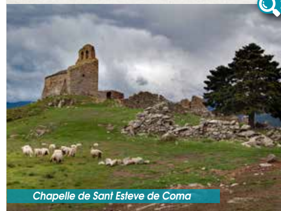
Chapelle de Sant Esteve de Coma