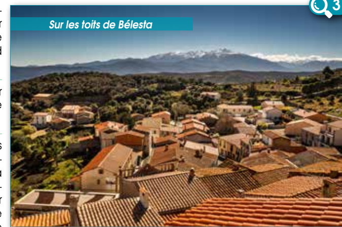
Sur les toits de Bélesta

8 Prenez à gauche et 100 mètres puis loin, au niveau de la table d'orientation, prenez sur votre droite la route sur 1,4 km. Après le grand lacet, continuez sur votre gauche par le chemin de Regleilla jusqu'au site des Orgues. De là, suivez l'itinéraire laissé à l'aller.