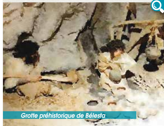
Grotte préhistorique de Bélesta