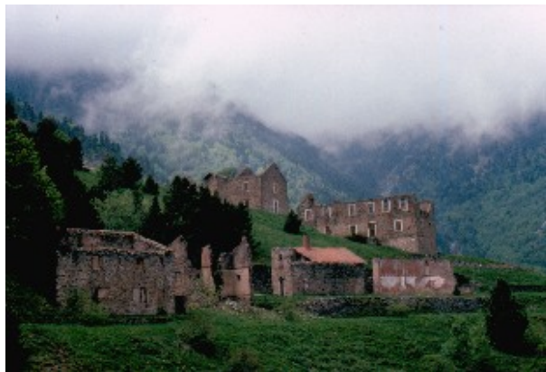
La Pinosa

Aujourd'hui, de nombreux vestiges nous rappellent ce glorieux passé, ancré dans la mémoire collective et contribuent à l'esprit des lieux. Une découverte poignante et authentique, dans le cadre naturel grandiose des versants et des vallées de la montagne sacrée des Catalans. Entre Arles-sur-Tech et Escaro, 15 anciens sites miniers jalonnent la Route du Fer du Canigó. Une bonne paire de chaussures de rando suffit ici pour un grand voyage dans le temps !